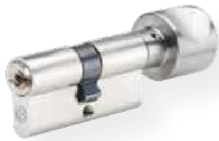
Profil-Knaufzylinder Nr. 815 RHM Messing matt vernickelt eine Seite Schließfunktion, andere Seite Alu-Knauf, F1 diverse Knaufformen erhältlich (abgebildet Form H)